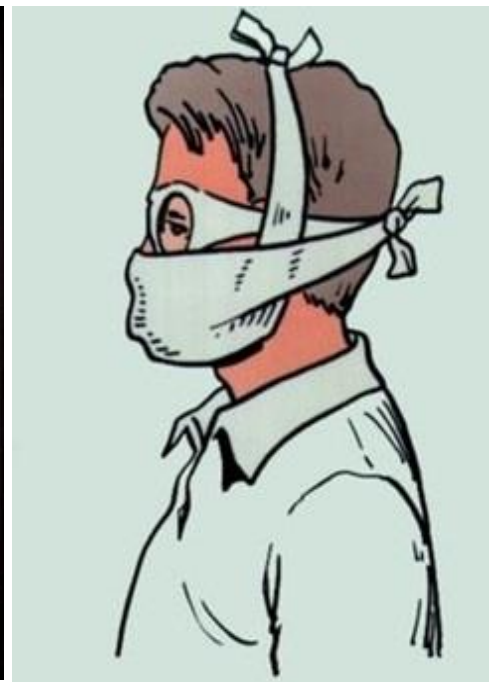
Рис. Схема изготовления и использования ватно-марлевой повязки

Если имеется марля, но нет ваты, можно изготовить марлевую повязку. Для этого вместо ваты на середину куска марли укладывают 5–6 слоев марли.