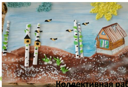
Коллективная работа «Весна-красна»