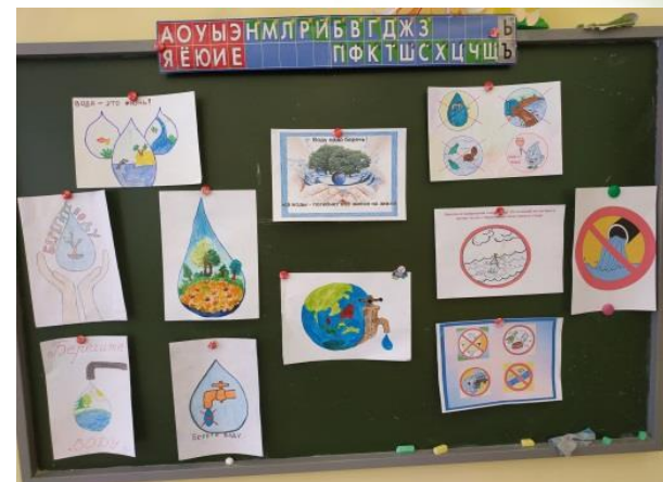
«Вода – источник жизни»