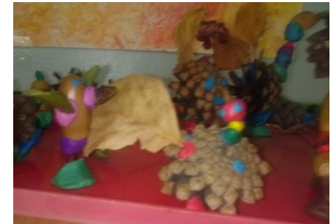
Подделки из природного материала