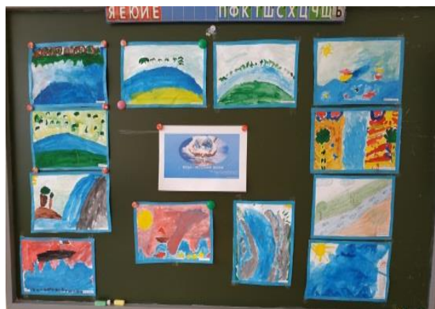
«Вода – наша жизнь»