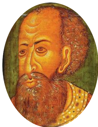
Царь Иван IV Грозный