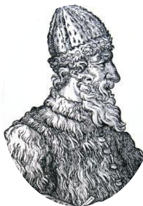
Великий князь Иван III

До XVIII века чиновники на Руси жили благодаря так называемым «кормлениям», то есть, при отсутствии оклада за исправление должности, разрешению на подношения от заинтересованных в их деятельности лиц. Одаривали их не только деньгами, но и «натурой» — мясом, рыбой, пирогами и пр., что было делом обыкновенным.