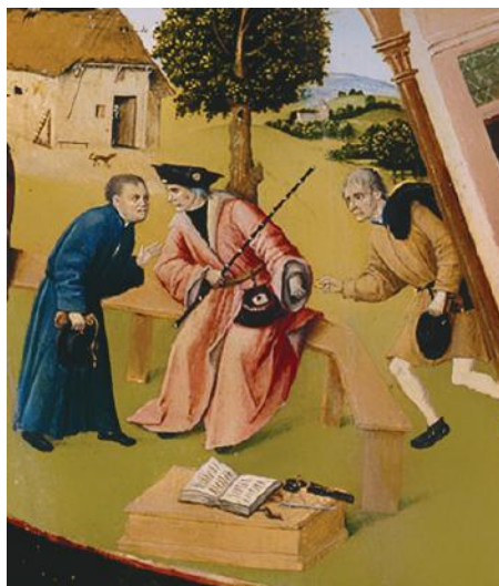
Фрагмент «Алчность» картины Иеронима Босха «Семь смертных грехов»

Рассматривая участников коррупции на примере взяточничества, стоит отметить, что в коррупционном процессе всегда участвуют две стороны. Одна сторона — это взяткополучатель (подкупаемый). Вторая сторона — это взяткодатель (осуществляющий подкуп). Также в процессе может участвовать и третья сторона — посредник.